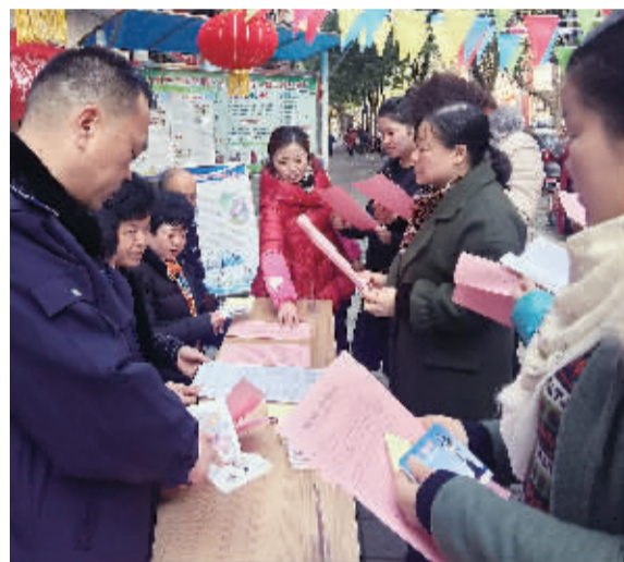
蔡甸区城管进社区开展查违法制宣传。

本报讯(记者郭佳 通讯员刘柳)近两日,蔡甸区城管委联合蔡甸街办事处进行“法制宣传进社区”活动,解答居民对城乡建设及查违控违方面的疑问并接受有关违建投诉。