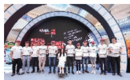
武汉站活动现场云集了9名爱心活动大使。

式，带动更多利益相关方共同回馈社会。”凯德商用中南区域总经理卢志昇在武汉参加活动时表示，目前凯德在湖北共援建了3所希望小学，分别位于英山孔家坊、麻城乘马岗和钟祥市，受益孩子超过1000名。每年，凯德也会开展“地球熄灯一小时”、“我的第一个书包”以及社区关爱等多项公益活动。（文/程艳 通讯员孙健）