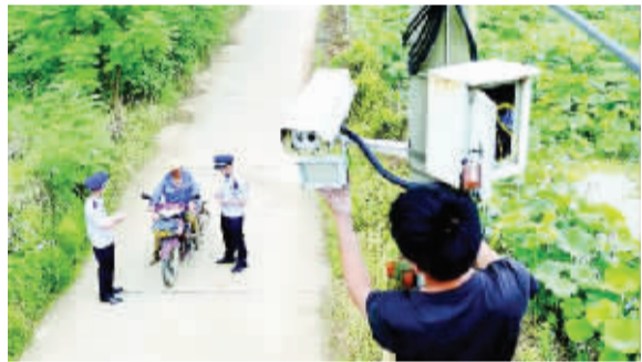
工作人员在检查视频设备。

偏僻山村,人烟稀少,出事调查不易,令人头痛。近年来,黄陂警方在六指派出所试行警务机制改制,通过建设监控系统形成“天网+地网”“警力+民力”“传统+科技”的立体防控体系,警务效能明显提升。截至发稿,今年当地没有发生一起案件。