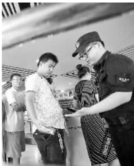
进站乘客接受身体扫描,如今安检更严格了

尽管安检可能会减缓出行的匆匆脚步,但为确保广大市民乘客乘车及整体运营安全,营造安全稳定的乘车环境,希望市民能配合接受安检,与武汉地铁共同把好出行路上的第一道关口。