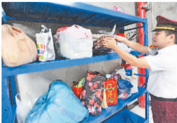
仅3号线沌阳大道站,近期失物就堆满了货架