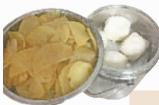
地铁里捡到的保温饭桶

11日中午,1号线汉口北站车控室,记者看到了个保温饭桶。一打开,土豆片的香味飘了出来,雪白的馒头还冒着热气。