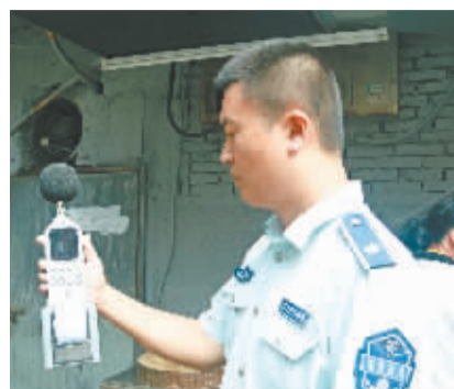
执法人员正在测试

殷莉介绍,过去接到油烟或噪音投诉后,虽然执法人员赶到了现场但并不能第一时间判定油烟或噪音是否超标,必须委托第三方检测机构或者环保部门在约定时间上门进行检测,如果要处罚,还需等有资质的单位提供监测报告,处理时间过长。现在,队员们可随时携带这些快速检测仪器执法,只需一到三分钟,仪器便可检测出油烟浓度或噪音的实时数据。 据了解,此次江汉区城管委共配备了18套油烟执法仪器,目前已经配备到各直属中队以及街道中队,这批“新装备”也将逐渐投入到日常执法中使用。