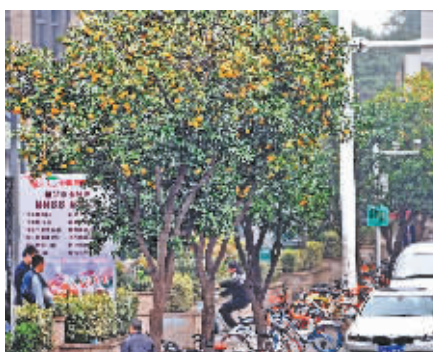
一个个小灯笼似的果实挂满枝头