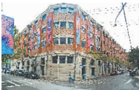
双年展分展区:平和打包厂