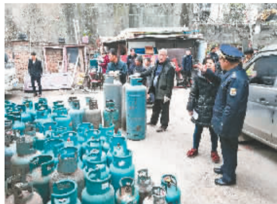
洪山区城管查扣的69个钢瓶

本报讯(记者张全录 通讯员刘洪凯)小区里,为什么这么浓的煤气味?城管执法人员接到反映赶到现场发现一套住房门前,悬挂着“送煤气”字样。进门一查,大家惊呆了,狭窄空间里,存有69个燃气钢瓶。且大多都装满燃气。再一查,这是个黑煤气窝点,什么手续都没有。昨天,洪山区城管委卓刀泉二中队执法人员查处了位于小河村的一处非法运营燃气点。